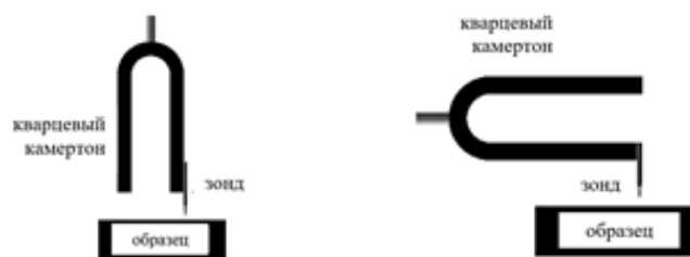
Рис. 1. Варианты монтажа капилляра на кварцевом камертоне

Стандартные зонды для магнитно-силовой микроскопии отличаются несложным производством, а их эксплуатация идентична использованию рядовых кантилеверов для атомно-силовой микроскопии. Однако существует серьезный минус, сужающий область их применения в исследованиях — это стремительный износ покрытия из-за физического стирания магнитного слоя с острия зонда вследствие его контакта с поверхностью.